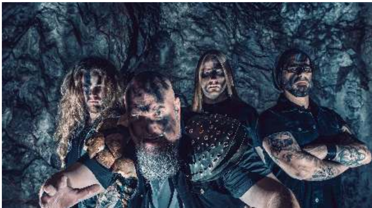
Rage, 4 november