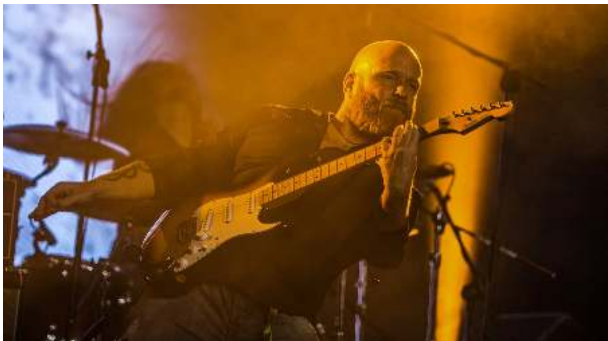
Antimatter, 25 november