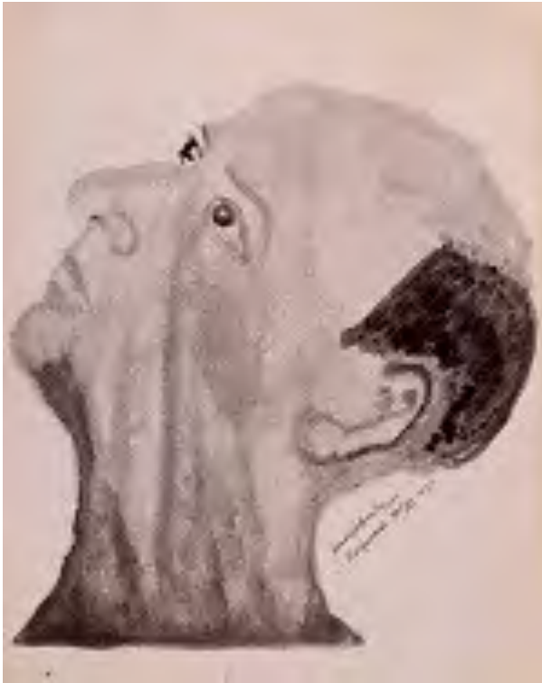
Zelfportret Arnold Schönberg, 1923