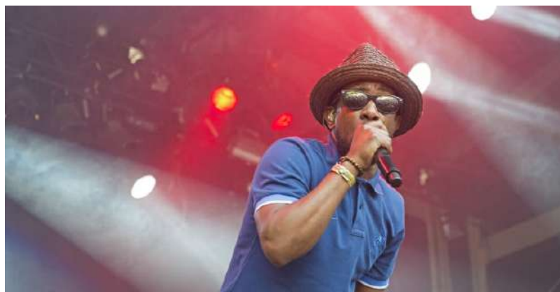
Postmen, 22 februari